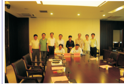
(图为签字仪式现场)

此次, 我院成为南京中医药大学教学医院, 不仅为我院康复科乃至全院的建设发展创造了新的机遇, 更为我们在医疗、教学、科研等方面提出了新的要求。因此, 为更好的承担起教学医院各项职责, 我院全体员工仍需不断努力, 争取在完成学校教学任务的同时, 在科研等方面有所突破, 从而为康复医学在我院的发展注入全新的力量。