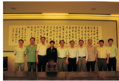
(图为签字仪式结束后双方代表合影)